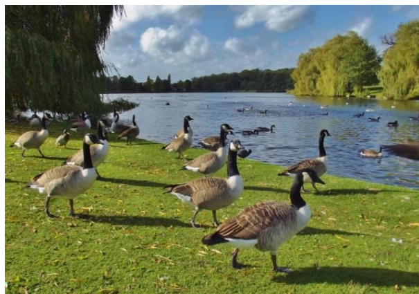
För många gäss på en kommunal badplats kan utgöra olägenhet för människors hälsa.

Kontoret för samhällsbyggnad arbetar med att utveckla och förvalta kommunens mark på uppdrag av kommunstyrelsen och för kommunstyrelseutskotten för teknik och fastighet samt miljö- och planfrågor. Enligt 4 § jaktlagen ansvarar markägaren för viltet vårdas i syfte att bevara arter samt främja en lämplig utveckling av viltstammarna med hänsyn till allmänna och enskilda intressen. Om inte detta ansvar fullföljs och viltskador skulle uppstå i odlingar eller trädgårdar kan kommunen som markägare komma att bli ersättningsskyldig till bland annat arrendatorer och villaägare. Det finns även andra risker kopplat vilt, till exempel gäss och andfåglar som uppehåller sig vid kommunens badplatser, där träcken kan utgöra olägenhet för människors hälsa.