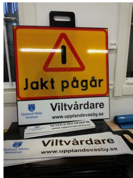
Informationsskyltar om jakt och viltvårdsinsats.