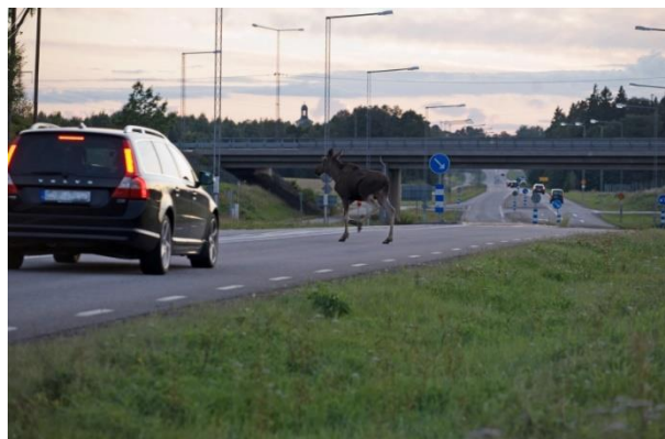
Älg som springer över väg.

Studier visar att vägar med mycket trafik, vegetation nära vägen samt vägar som korsar vattendrag är de mest utsatta områdena för viltolyckor. Om dessa områden dessutom är skogsbeklädda, bitvis skogsbeklädda med öppna luckor eller att många landskapstyper finns närvarande är risken för kollisioner ännu större. Områden med jordbruk samt urban bebyggelse är generellt sätt områden som är mindre utsatta för viltolyckor. Dock visar statistiken från Nationella Viltolycksrådet att viltolyckorna sker utspritt över hela kommunen. Det finns däremot metoder för att begränsa risken för viltkollisioner utmed vägarna.